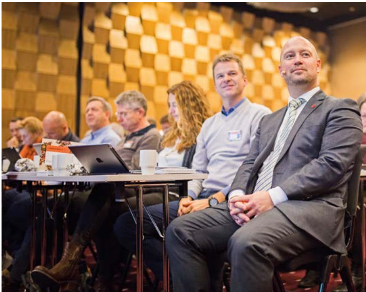
Statsråden på plass på PF sitt landsmøte.