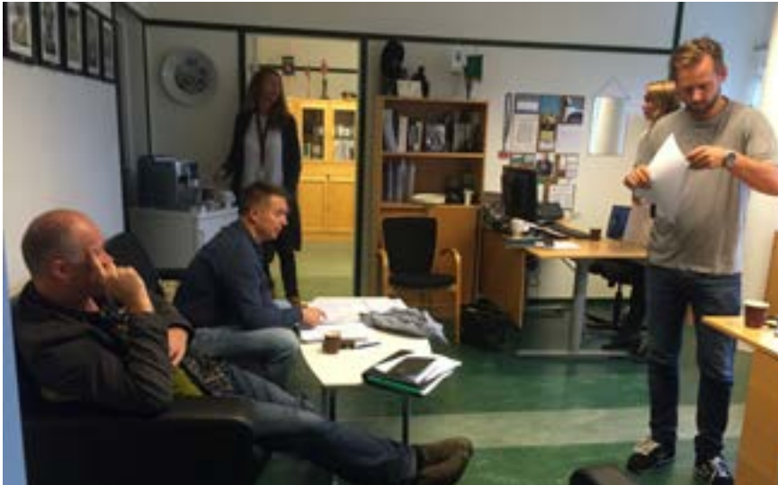
Gode faglige diskusjoner på foreningskontoret.

saker og fremtidige planer. Her deles viktig informasjon om fremdrift i prosesser og omorganiseringer. Politireformen har vært et gjennomgående tema med flere ringvirkninger for organisasjonen. I 2016 drøftet vi 13 saker og forhandlet 56. Sakene spenner fra utlysninger, lønnskrav for enkeltmedarbeidere og grupper av ansatte til omorganiseringer. Diskusjonen i IDF er taushetsbelagt, men alle vedtektsreferatene ligger åpent tilgjengelig for ansatte på intranett. Ta en titt dersom du er nysgjerrig eller vil lære mer om hvilke type saker som behandles på dette nivået.