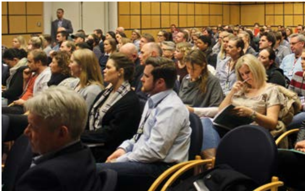
Fullsatt parolesal.

31. mars 2016 hvor 3/4 av medlemmene måtte stemme for de nye vedtektene før PST kunne bli eget lokallag.