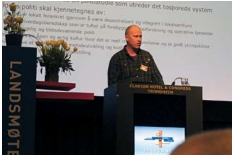
Leder av lederutvalget på talerstolen.