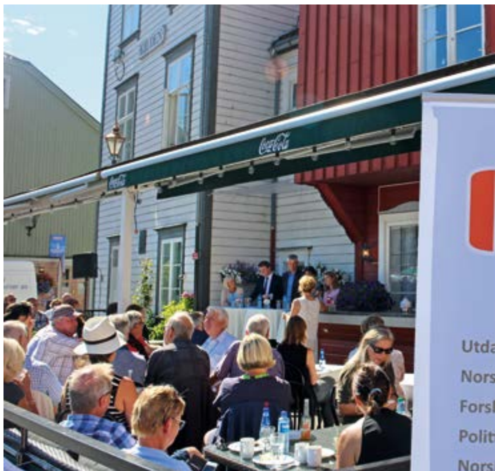
PF og UNIO på Arendalsuka.

Nye arbeidsoppgaver, ny struktur, ny arbeidsmetodikk, nye ledere – endringer skaper også nye muligheter for lønnsarbeid. OPF er godt i gang med å kartlegge lønnsnivået og arbeidsoppgavene til medlemsmassen i de to gamle politidistriktene for å sikre at ansatte i samme distrikt med de samme arbeidsoppgave-