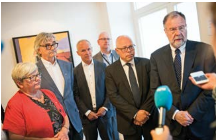
Hovedsammenslutningene i Unio-stat sammen med Riksmeklingsmannen.

2.5.1 har vært tema på flere samlinger i hovedtillitsvalgforum i forkant av lønnsoppgjøret. De hovedtillitsvalgte og sivilutvalget ble oppfordret til å avholde møte for de plasstillitsvalgte på sin seksjon for å innhente innspill på hva OPF skulle prioritere i lønnsoppgjøret. Styret fattet så et vedtak for hva som var OPF sine føringer til forhandlingsutvalget inn i forhandlingene. Vedtaket satte rammer for forhandlingsutvalgets prioriteringer, men var vidt formulert slik at det ikke skulle sette for mange begrensninger. Utfordringen i årets lokale lønnsoppgjør var at man ikke hadde forhandlet ferdig nytt organisasjonskart. Det uklare kartet