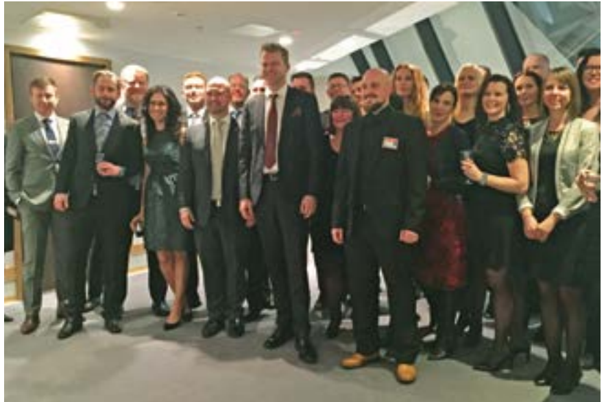
Statsråden og forbundsleder med OPF sin delegasjon på landsmøtet.