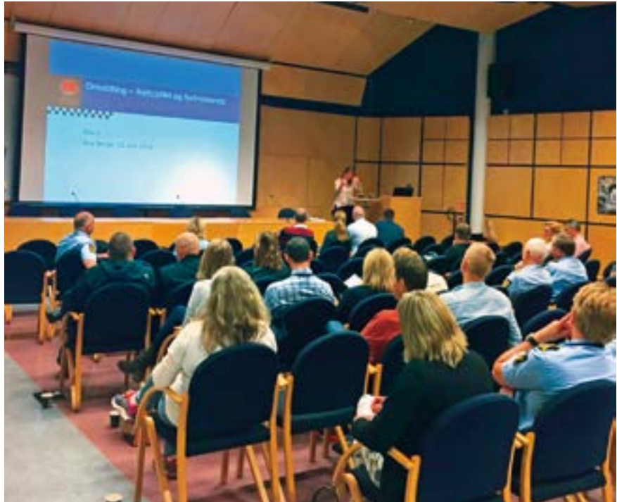
Medlemsmøte for ledermedlemmer i OPF.

I 2015 fikk vi på plass en enhetlig seniorpolitikk som bl.a. omfattet beslutning om faste årlige 2.3.4 forhandlinger for denne gruppen. På tross av stramt budsjett ble det satt av midler og forhandlinger ble gjennomført i april 2016 med uttelling for våre medlemmer.