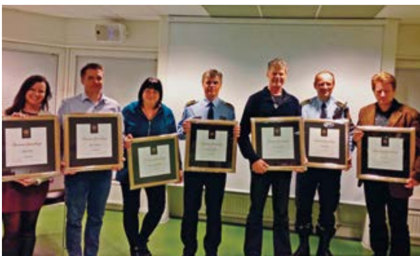
Nybakte æresmedlemmer.