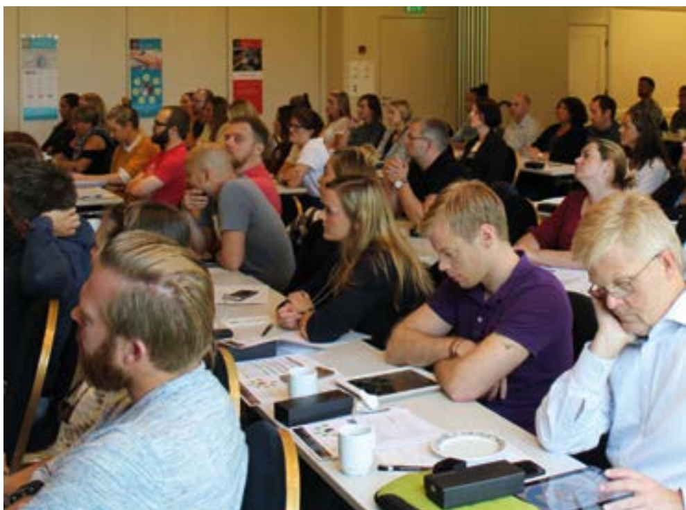
Kickoff for alle tillitsvalgte i nye OPF.