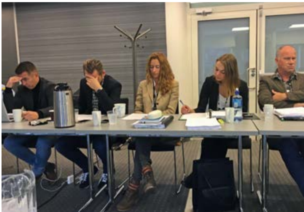
Krevende forhandlinger om ny organisering av Oslo politidistrikt.

Politijuristene gikk til brudd i forhandlingene. Stridsspørsmålet var organisering av påtalemyndigheten i Oslo politidistrikt. Partene i OPD ble enige om mekling for å komme til enighet. Når