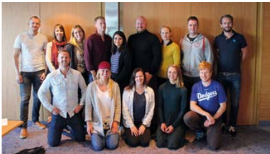
Engasjerte tillitsvalgte valgt ut til Trinn2-kurs.