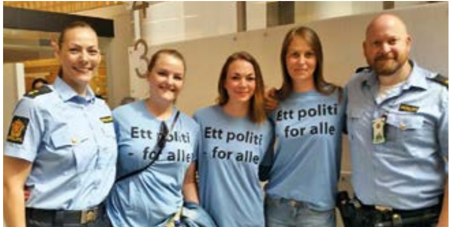
Tillitsvalgte på Pride – et politi for alle!