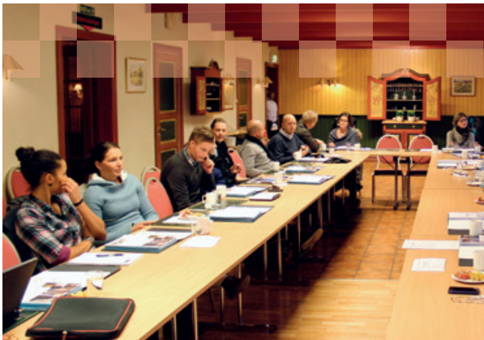
Delegasjonsmøte i forkant av Landsmøte 2013.