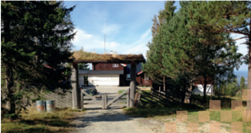
A-hytta sett fra parkeringsplassen