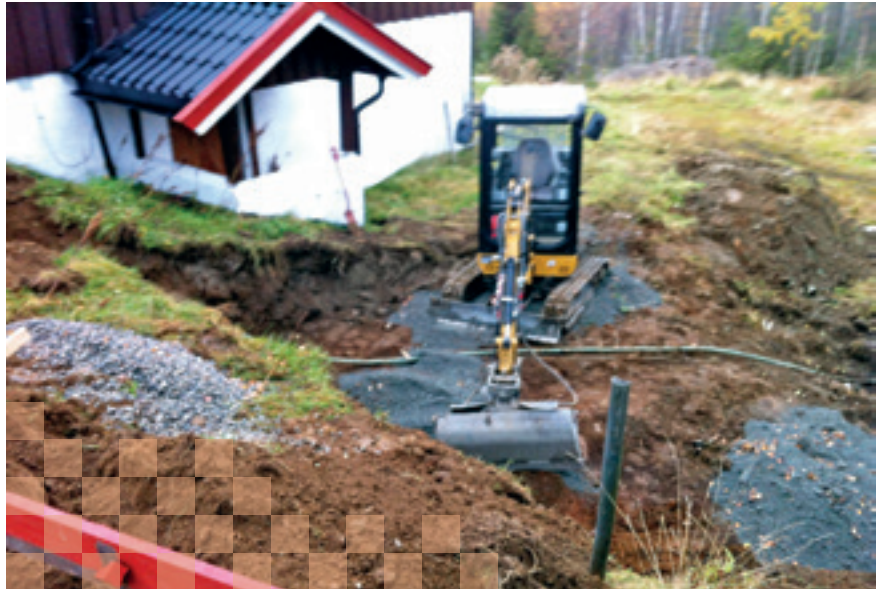
Byggearbeider på Sjøhaugen.