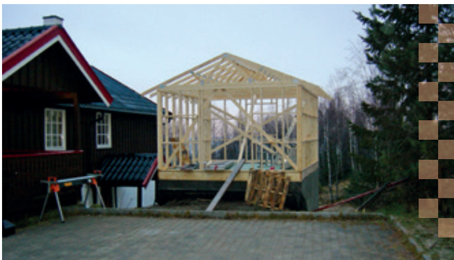
Nytt styrerom og vedbod

Videre er det kjøpt inn en del dyner, puter og madrasser som er byttet ut på noen soverom. Det er også kjøpt inn speil og knaggrekker til de soverommene som manglet dette. I tillegg er det kjøpt inn 10 nye sengehester som er montert på senger hvor gamle var ødelagt. Det er bygget levegg på terrassen mot B-hytta. Det er ryddet i kjeller under toalettbygningen og det er tatt hovedrenn-gjøring på hytta.