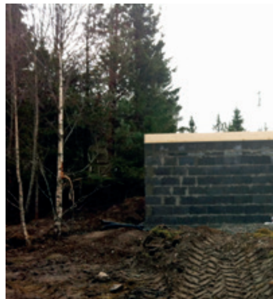
Byggearbeider på Sjøhaugen.